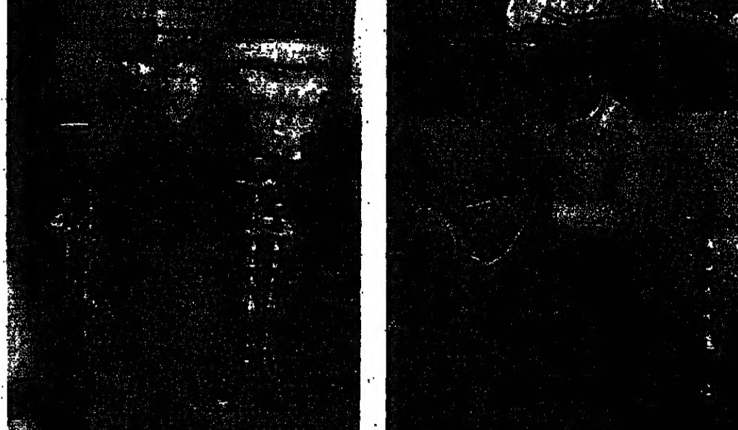
تهرجي ومجموعه تراجيل دفعة واحدة